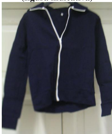
Fig. 2 (figura indicativa)