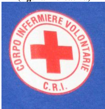
Fig. 4 (figura indicativa)